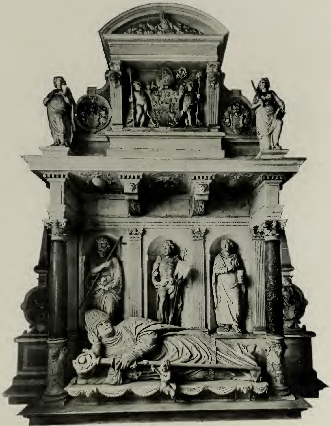
Kaspar von Logau.